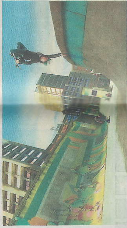
• Spring op je board en gebruik alles wat je op straat tegenkomt.

sportgame met Olympisch kampioen Shaun White in de titel waarin snowboarding centraal stond, is nu een t skateboarding uitgekomen. Op je virtuele board zijn illende tricks mogelijk. Er zijn versies voor de PS3, Nintendo Wii. Shaun White Skateboarding behoort tot de die ook op een 3D-tv is af te spelen. White die vanwege ook wel de vliegende tomaat wordt genoemd, is pro- skateboarder. Maar hij kan ook goed overweg met de skate, ank met vier wielotjes.